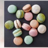
ФРЕНСКИ МАКАРОНИ 40 БР. / 99 ЛВ.