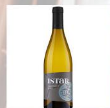
ISTAR, SAUVIGNON BLANC, BONONIA