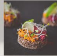
ХАПКА С ЧЕРВЕНО ЦВЕКЛО И СЛАДЪК КАРТОФ 20 БР. / 50 ЛВ.