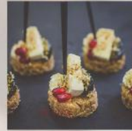
ХАПКА С БРИ, ЗЕЛЕНИ СМОКИНИ И НАР 20 БР. / 50 ЛВ.