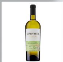
GOMOTARTZI, SAUVIGNON BLANC, BONONIA