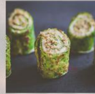
СПАНАЧЕНА ПАЛАЧИНКА С КРЕМА СИРЕНЕ 20 БР. / 50 ЛВ.