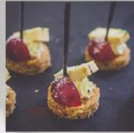
ХАПКА С ГРОЗДЕ И СИНЬО СИРЕНЕ 20 БР. / 50 ЛВ.