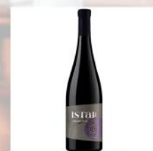
ISTAR, CABERNET FRANC, BONONIA