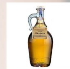
СТАРОСЕЛ ДОМАШНА, ГРЗДОВА