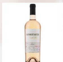
GOMOTARTZI ROSE, BONONIA