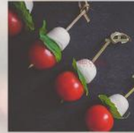
МИНИ ШИШЧЕ С МОЦАРЕЛА И ЧЕРИ ДОМАТ 20 БР. / 50 ЛВ.