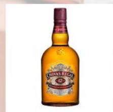
CHIVAS REGAL 12YO