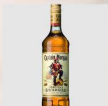
CAPTAIN MORGAN GOLD