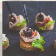
ХАПКА С ПРОШУТО И МУС ОТ СИРЕНА 20 БР. / 54 ЛВ.