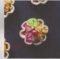
ТАРТАЛЕТА С МУС ОТ ЧЕРВЕНО ЦВЕКЛО, АВОКАДО И ХУМУС 20 БР. / 56 ЛВ.