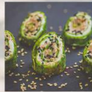
СПАНАЧЕНА ПАЛАЧИНКА СЪС СЪОМГА И КРЕМА СИРЕНЕ 20 БР. / 62 ЛВ.