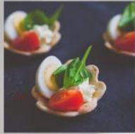
ТАРТАЛЕТА С ПЪДПЪДЪЧНИ ЯЙЦА И МУС ОТ СИРЕНА 20 БР. / 58 ЛВ.