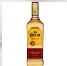
JOSE CUERVO GOLD