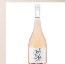
ROSE OOH LA LA, BONONIA