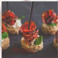
ХАПКА С ПИКАНТЕН САЛАМ И МУС ОТ СИРЕНА 20 БР. / 52 ЛВ.