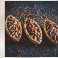
ТАРТАЛЕТА С ШОКОЛАДОВ МУС 20 БР. / 56 ЛВ.