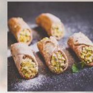
КАНОЛИ С РИКОТА И ШАМ ФЪСТЪК 20 БР. / 56 ЛВ.