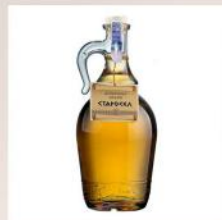
СТАРОСЕЛ ДОМАШНА, ГРЗДОВА