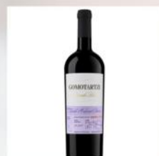
GOMOTARTZI, CABERNET FRANC & SYRAH