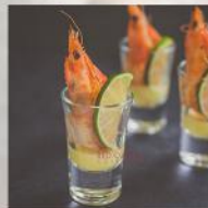
ТИГРОВА СКАРИДА В ШОТ С ЦИТРУСОВ ДРЕСИНГ 20 БР. / 66 ЛВ.